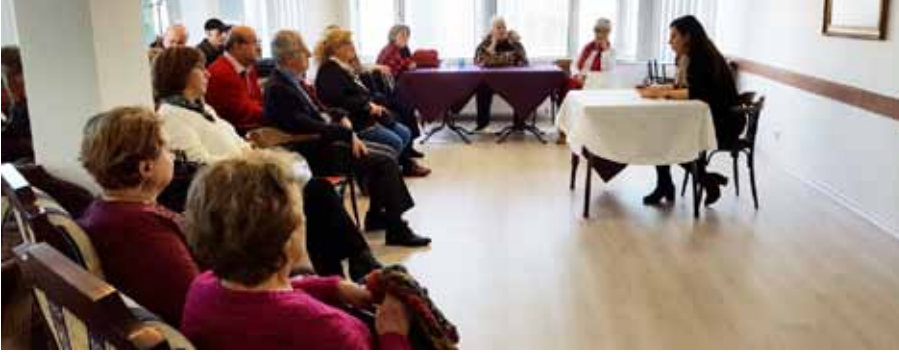
Genpa Denizcilik A.Ş.'de gerçekleştirdiğimiz bir seminerden...

Firmaları ile sağlık danışmanlığı ve hizmetlerimiz ile ilgili anlaşmalar sağlanmıştır.